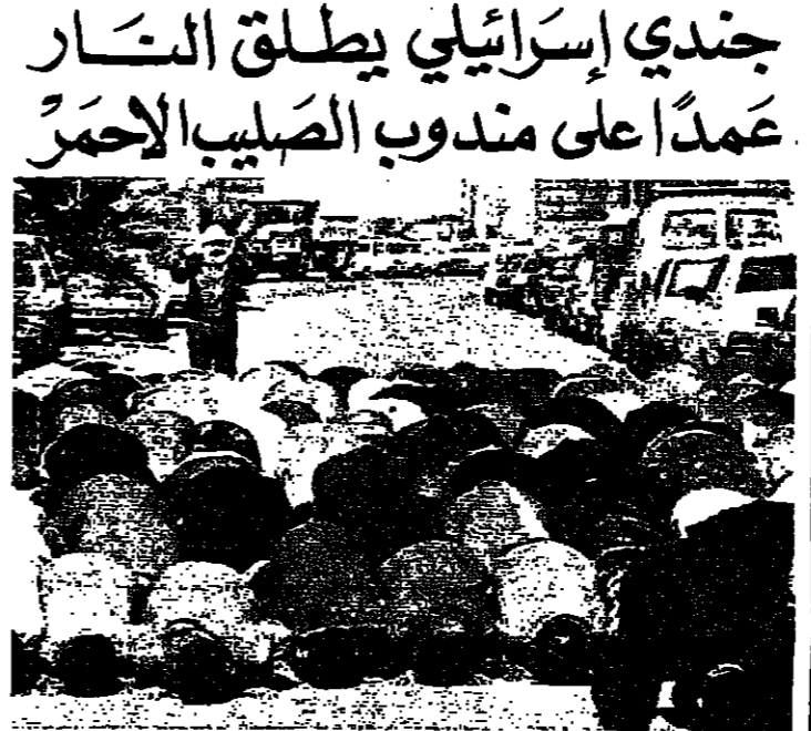
مصلون شاق بهم مسجد الخليل يذوقون صلاة الجمعة في الطريق العلم